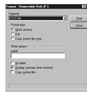
Figuur 2: Het dialoogvenster Verwisselbare schijf formatteren

Lees de PDF-versie van de Gebruikershandleiding voor meer informatie over uw speler: d:\manual\nederlnds\manual.pdf (waarbij u d: vervangt door de stationsaanduiding van uw cd-rom-/dvd-rom-station.)