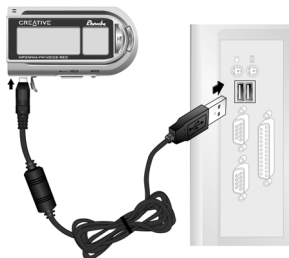
Figuur 1: De speler aansluiten